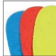
HAIX® Vario Wide Fit System