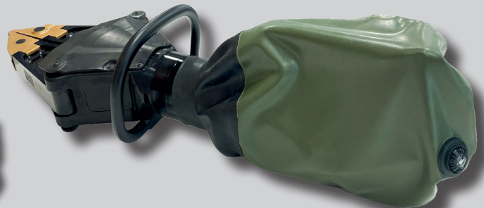
* IP-BAG LARGE, ID 1101497